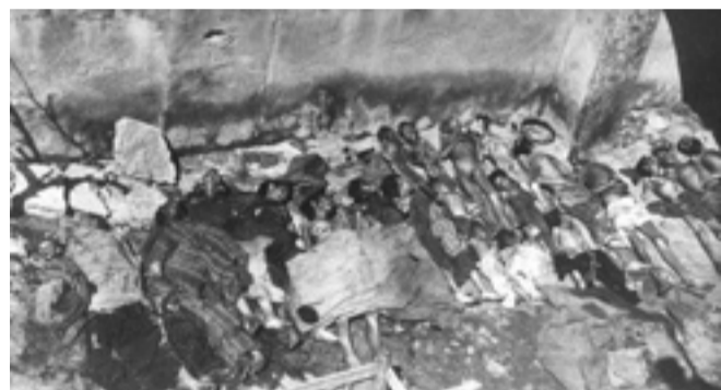
от турска страна е повлияло на много личности: "Кой днес говори за арменските

Тази снимка все още поражда дискусии; до ден днешен турските историци оспорват какво се е случило с арменците. Постоянното отричане на геноцида