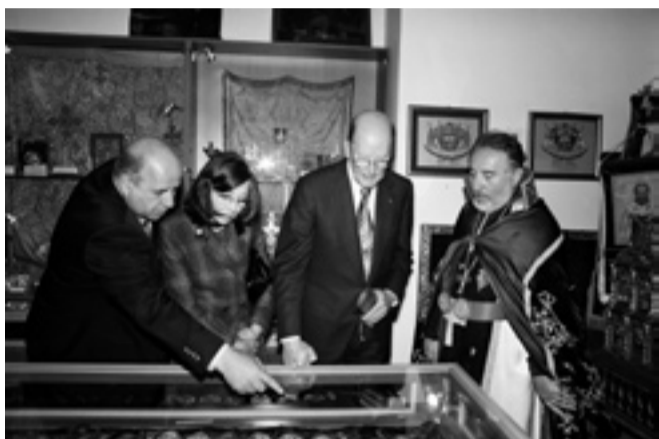
В музея за църковна утвар

отлагана от три години по- кана, която най-после се е осъществила. „Арменци- те са признателни за топл- ия прием и гостоприем- ство, което България им оказва. Основен принос за това има дядо ви. Пазите ли някакъв спомен?” – бе запитан от журналистите Симеон II. „За добрите от- ношения винаги се е гово- рило. Помня от майка ми и баща ми. А аз мисля, че е голям принос за България да има арменци. -каза Си- меон II.